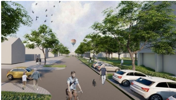
Bernard de Wildestraat