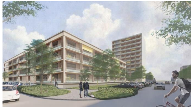
Willem de Bruynstraat