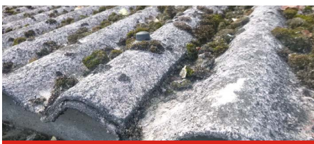
Golfplaten op berging/aanbouw