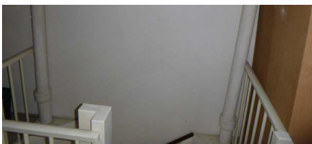
Buizen als ventilatie of riolering