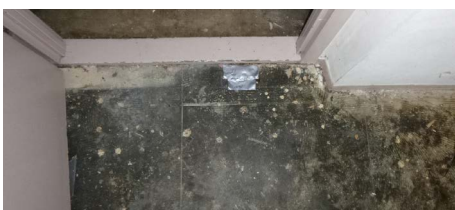
Colovinyltegels + zwarte lijmlaag