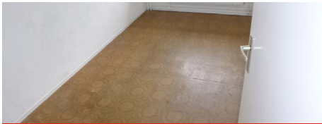
Vloerzeil, diverse motieven, witte papieren onderlaag